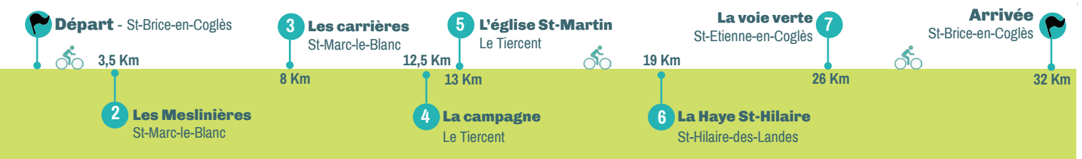
Extrait de SCAN 25® © IGN - 2015 Autorisation n° 40-15.60

En arrivant à Saint-Marc-Le-Blanc, on pénètre au cœur du pays du granit. Les nombreuses carrières de granit bleu et les usines de transformation témoignent de ce riche passé industriel. La notoriété de ce matériau dépasse peu à peu les frontières du pays. Il est exporté notamment à Paris pour la construction de grands édifices et le pavage de l'hôtel de Ville et de la place du Louvre. Ici, les tailleurs de pierres étaient surnommés les « picaous » en référence au bruit du marteau tapé en rythme sur la pierre.